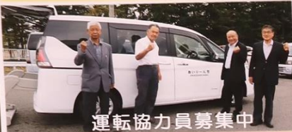
運転協力員募集中

あいりーん号新車になりました。より安全安心に利用出来るようになり、各種研修も行ってます。